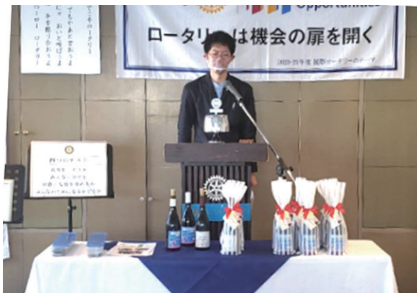
ボジョレヌーボー解禁・やつや黒田ソムリエ様